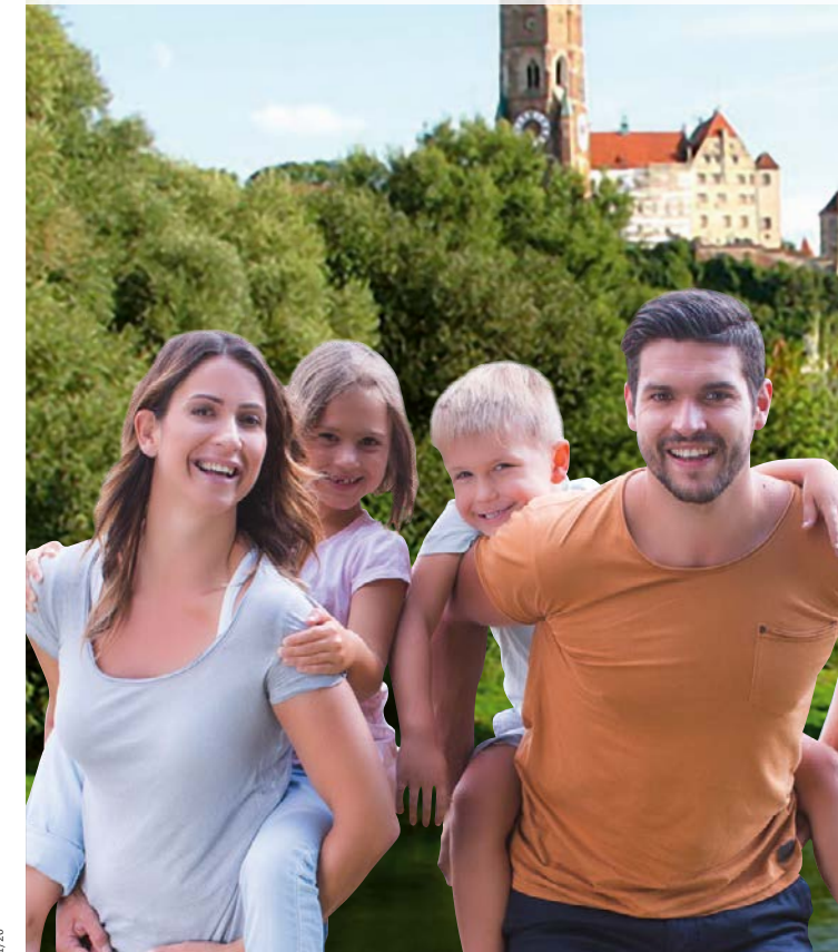
Strom Landshut 1.000 | 01/20

kundenorientiert. nachhaltig. effizient.